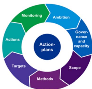
FIGUUR: ELEMENTEN KLIMAATACTIEPLAN